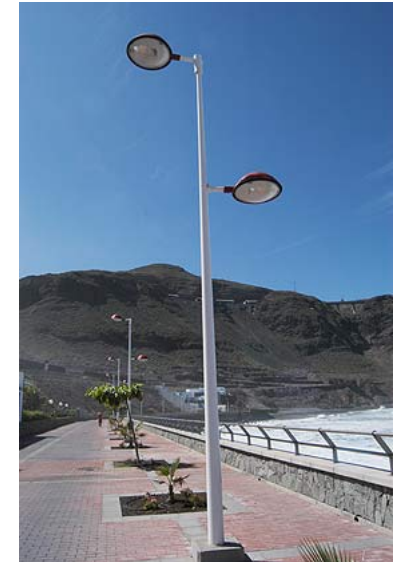
Nuevo paseo marítimo en San Felipe

Al bello conjunto histórico del casco y a sus importantes yacimientos arqueológicos, hay que sumar la playa de San Felipe, con un nuevo paseo marítimo para disfrutar del contacto con el mar.