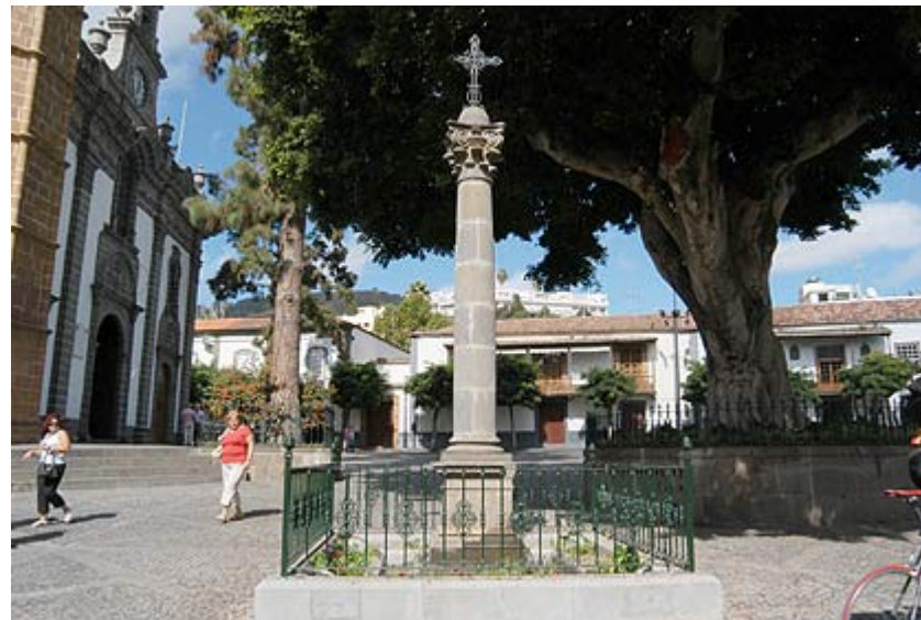
Mejoras en el casco histórico: Cruz Verde

Un gran espacio de ocio se abre entre la hermosa finca de Osorio y la villa: el Parque José Hernández Jiménez. Además, en el casco histórico, la zona de la Cruz Verde ve mejorado su aspecto.