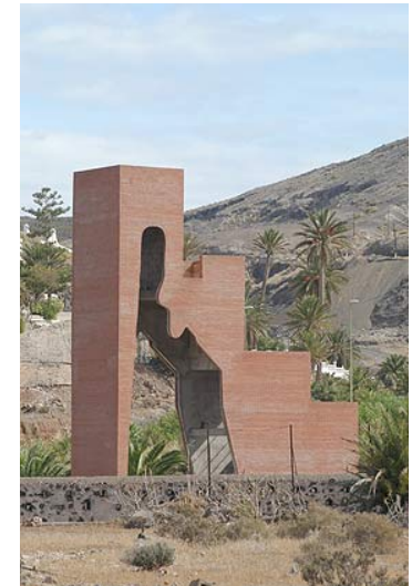
Complejo Cultural Dedo de Dios, en Agaete