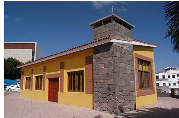
Nueva Oficina de Turismo

La mejora de las infraestructuras en la zona costera y la atención adecuada con una renovada oficina de Turismo facilitarán al visitante el disfrute de esta zona.