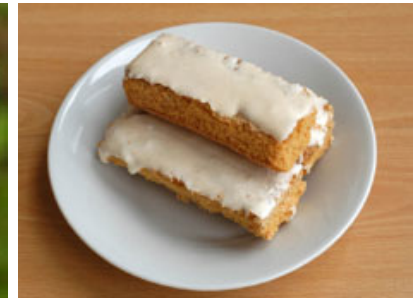
Flora de laurisilva y tradicionales bizcochos de Moya