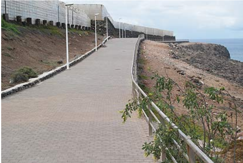
Intervención en paisaje y paseo de la costa entre Caleta de Arriba y La Guancha

El camino entre Caleta de Arriba y La Guancha, y las actuaciones realizadas en el casco histórico invitan a pasear en un municipio cargado de atractivos arqueológicos y monumentales.