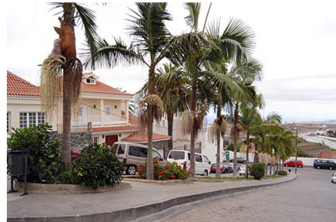
Embellecimiento de vías