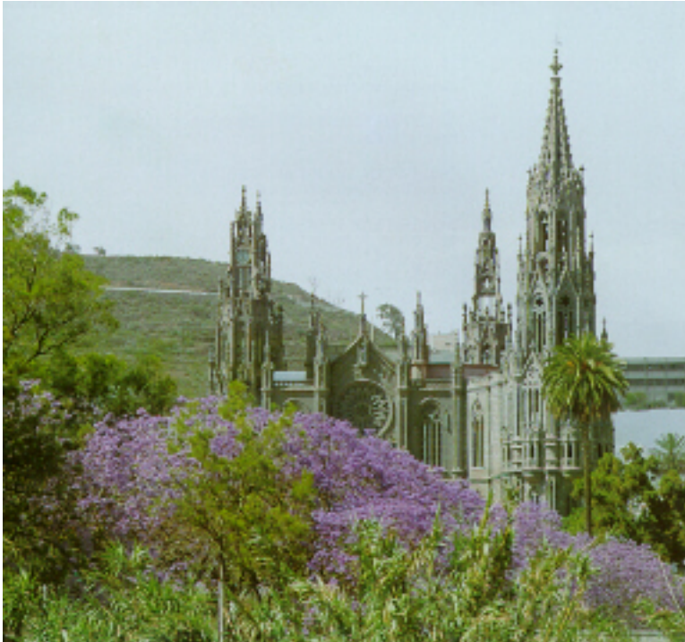
Vista de la iglesia de Arucas

El eje de interés turístico en Arucas es su propio casco y su valor monumental.