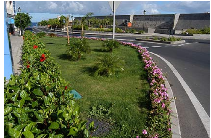
Embellecimiento y ajardinamiento del Puerto de las Nieves