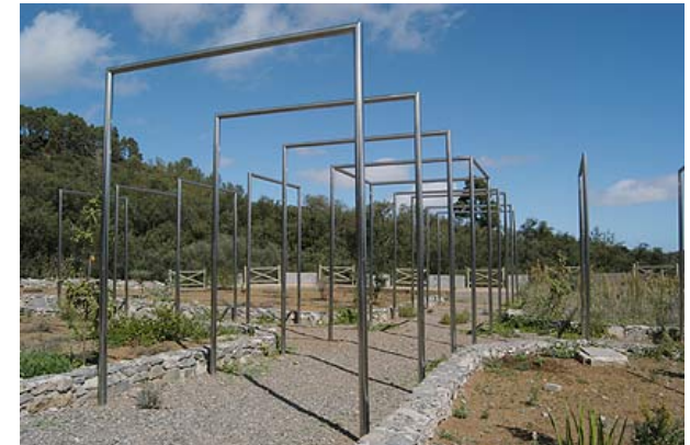
Nuevo Parque José Hernández Jiménez

Un gran espacio de ocio se abre entre la hermosa finca de Osorio y la villa: el Parque José Hernández Jiménez. Además, en el casco histórico, la zona de la Cruz Verde ve mejorado su aspecto.