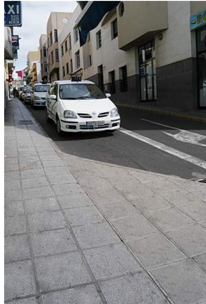
Mejoras de vías peatonales y para acceder al transporte público

El camino entre Caleta de Arriba y La Guancha, y las actuaciones realizadas en el casco histórico invitan a pasear en un municipio cargado de atractivos arqueológicos y monumentales.