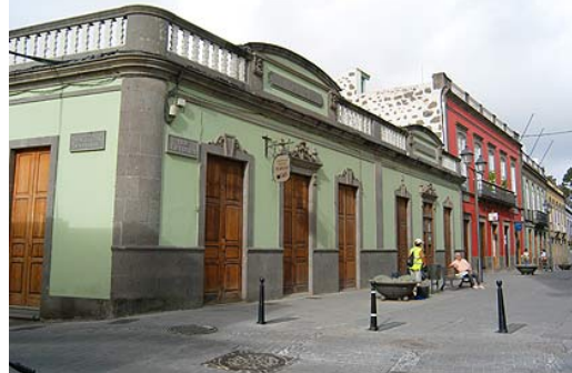
Tratamiento de fachadas