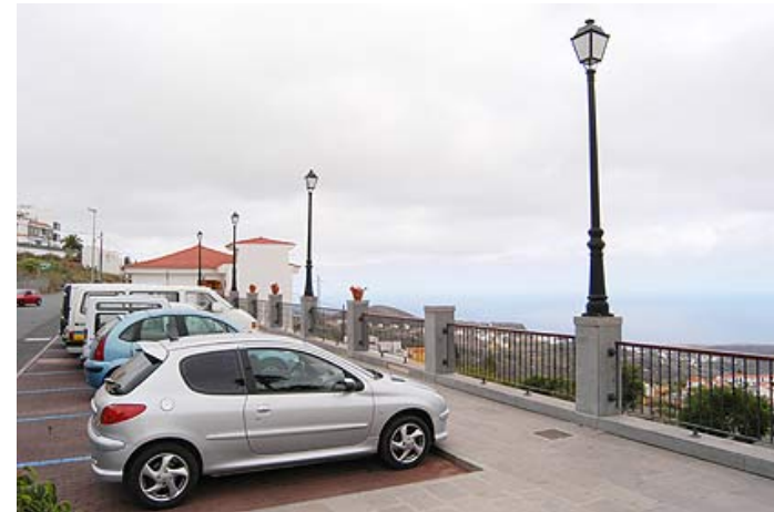
Paseo y mirador frente al mercadillo

El entorno del mercadillo se ve mejorado con la presencia de un paseo mirador que invita a disfrutar de la panorámica del norte de la Isla. El nuevo adoquinado de la Calle Leopoldo Matos invita al paseo.