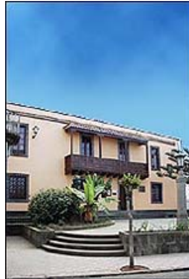
Casa Museo de Tomás Morales

De costa a cumbre, el municipio tiene diversos recursos atractivos para el turista