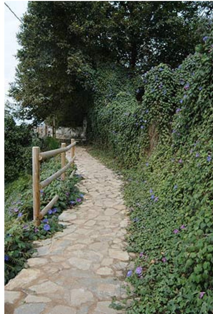
Acondicionamiento de senderos

La mayor riqueza turística de este municipio está en su naturaleza. Recorrerla será atractivo por el acondicionamiento de sus antiguos caminos rurales. Otra incitativa es la escultura mural Las Lavanderas, que recuerda una tradición de esta villa de ricos manantiales.