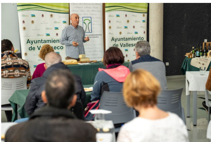
Imagen: Cata de quesos y sidra realizada en Valleseco.