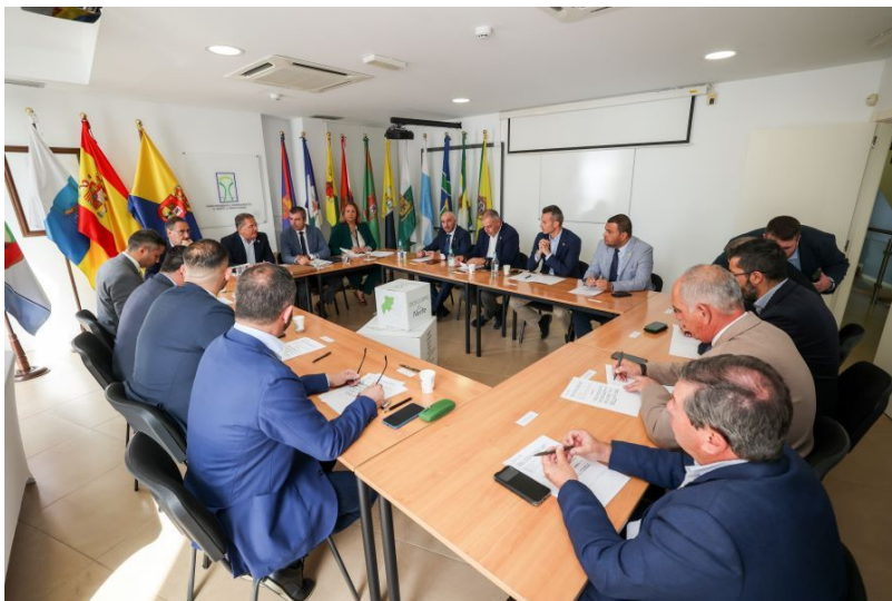
Imagen: Visita del

A lo largo del año 2024 la Mancomunidad ha mantenido una intensa agenda de trabajo con el resto de instituciones, empresas y agentes sociales con el objetivo de abordar diferentes aspectos de relevancia para la Comarca.