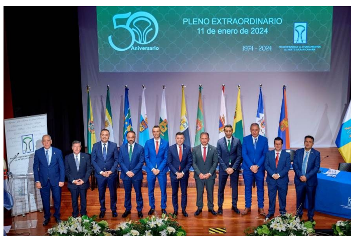
Imagen: Pleno de la Mancomunidad

En el siguiente cuadro se muestran las fechas de las Juntas de Gobierno celebradas a lo largo del año 2024: