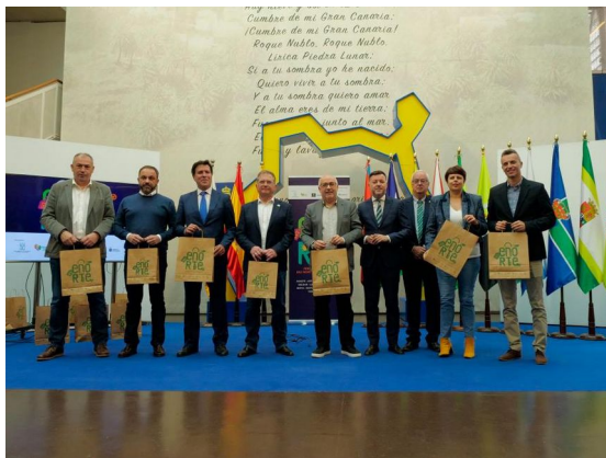
Imagen de la presentación