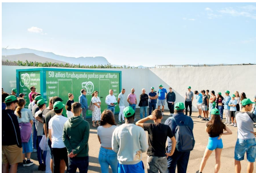
Imagen: bienvenida del proyecto Buclé.

En los talleres educativos que se realizaron durante dos mañanas, participaron alumnado del IES Bañaderos Cipriano Acosta y el IES Arucas- Domingo Rivero.