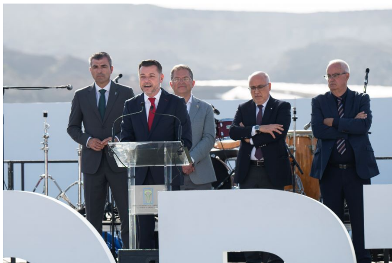
Imagen de la Inauguración Oficial de ENORTE 2024