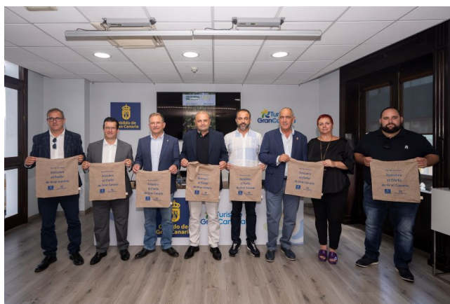
actos Día Mundial del Turismo

En este año 2024 se celebró, en colaboración con Turismo Gran Canaria, junto a los once ayuntamientos pertenecientes a la Mancomunidad, el Día Mundial del Turismo en Moya.