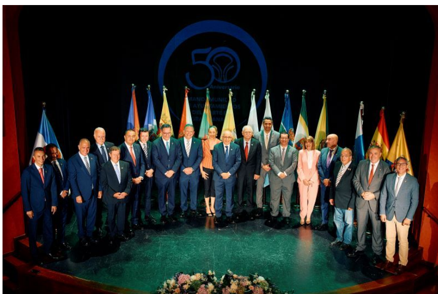
Imagen: Alcaldes y expresidentes de la mancomunidad.

En este acto se presentó un vídeo resumen de la historia de la Mancomunidad, que pueden ver en el siguiente enlace: https://youtu.be/4CWwspZ1LZo