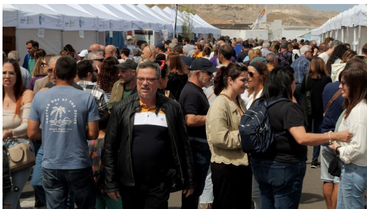
aparcamiento de La Quinta

La XXII Feria Empresarial del Norte de Gran Canaria: ENORTE, celebrada en la ciudad de Gáldar del 5 al 7 de abril del año 2024 , ha mostrado su consolidación como uno de los eventos empresariales más importantes celebrados en la Isla de Gran Canaria, constituyéndose como primera feria comarcal en el 2002, año en el que se celebró su primera edición.