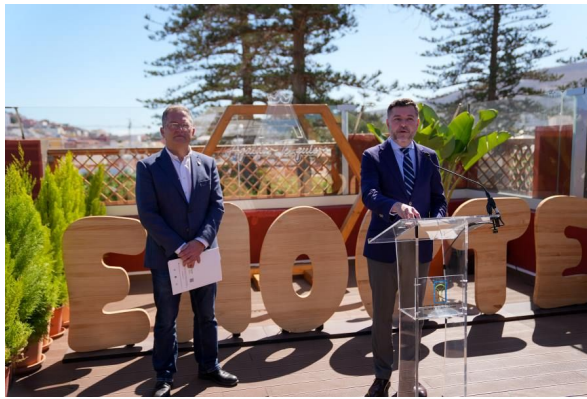
Imagen de la presentación en la terraza del Hotel Ágaldar.

El 15 de marzo se realizó una primera rueda de prensa de presentación de los preparativos y organización de la XXII edición de la Feria Enorte que se celebró en el Hotel Ágaldar.