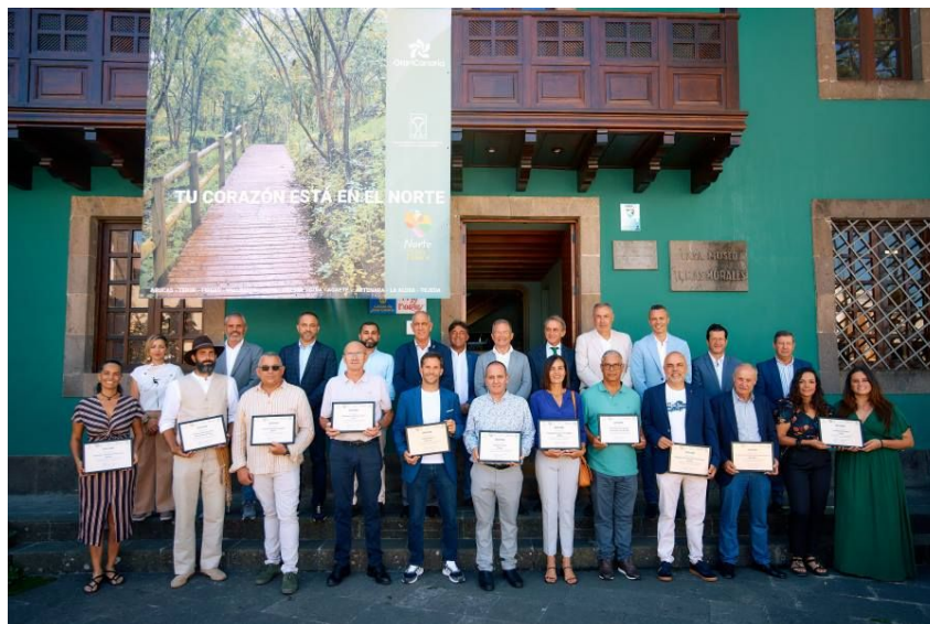
Imagen: Acto de entrega de los diplomas de reconocimiento turístico del Norte de Gran Canaria

Firgas, una iniciativa con la que buscan facilitar la inserción de la mujer rural en el mundo laboral y Bodegas Bentayga-Vinos Agala de Tejeda una actividad enoturística, que se han convertido en referentes en la isla.