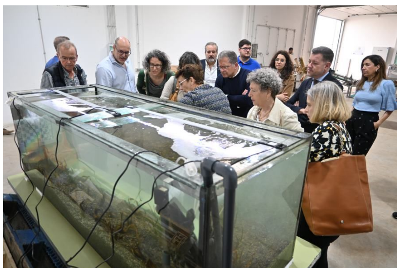
Imagen: visita a los acuarios instalados en el parque.

En la nave del parque se instaló un proyecto de investigación de la Universidad de Las Palmas de Gran Canaria, que tiene como objetivo restaurar zonas costeras degradadas, tanto del mediterráneo como del atlántico, con algas.