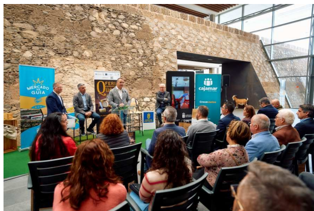
Imagen de la rueda de prensa presentación de la Feria