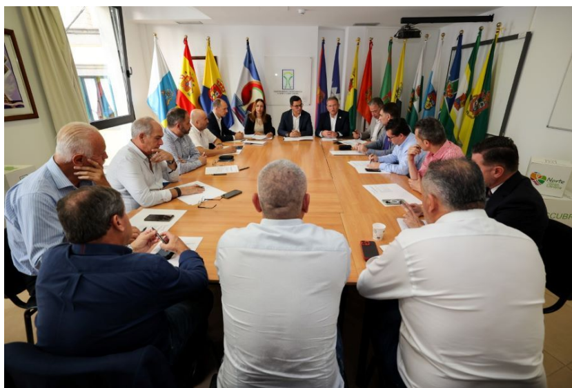
Imagen: Reunión celebrada con el Consejero de Obras Públicas, Vivienda y Movilidad.