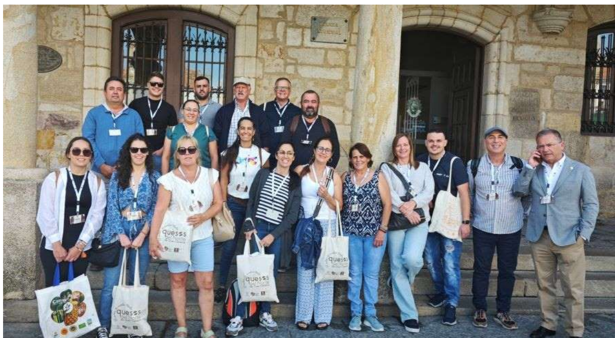
Imagen del grupo asistente a Fromago

Por otro lado, un objetivo más de la subvención ha sido fomentar el conocimiento y la creación de redes con el resto de queserías y territorios participantes en la Feria.