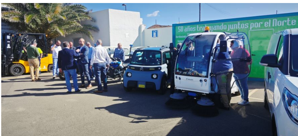
Imagen: acto de entrega de varios vehículos

En el año 2024 se ejecutaron, tanto las obras de alumbrado, como las de adquisición de vehículos eléctricos entregados a los municipios por parte de la Mancomunidad. Algunos de los vehículos adquiridos se entregaron en en el año 2024 y otros se harán entrega en el año 2025.