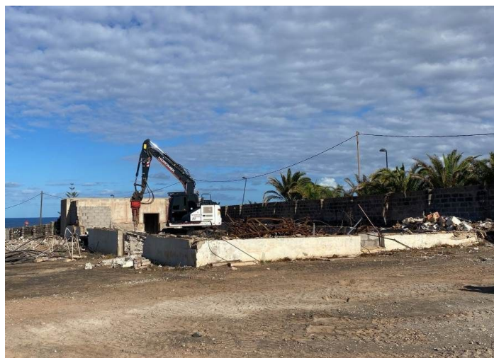
Imagen: demolición antigua nave

A lo largo del año se demolió la antigua nave del parque, con el objetivo de posibilitar una nueva gracias a una subvención del Cabildo de Gran Canaria que tiene previsto realizarse en 2025.