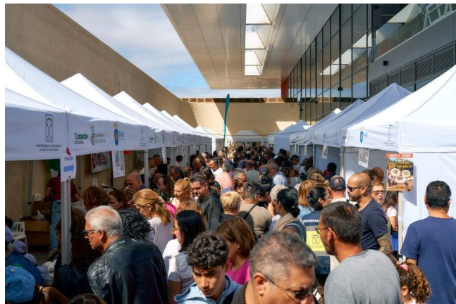
Imagen del interior del Mercado Comarcal.

La VII edición de la Feria Europea del Queso, organizada por la Mancomunidad del Norte, se celebró en el Mercado Agrícola Comarcal de Santa María de Guía los días 9 y 10 de marzo en colaboración con el Ayuntamiento de Santa María de Guía y el apoyo de la Consejería de Sector Primario, Soberanía Alimentaria y Seguridad Hídrica del Cabildo de Gran Canaria y la Consejería de Agricultura, Ganadería, Pesca y Soberanía Alimentaria del Gobierno de Canarias.