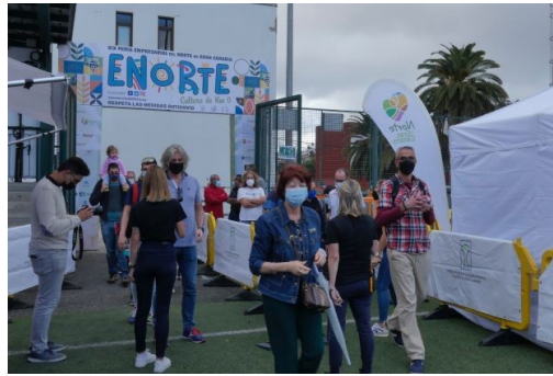
Imagen del control de acceso al estadio

El apartado de difusión y publicidad es fundamental para garantizar el éxito de la Feria, por lo que se ha dedicado un esfuerzo considerable a este concepto. La Feria dispone de un gabinete de prensa que lleva a cabo la difusión, asegurando la cobertura de la información según los recursos existentes. Este año se ha realizado un Plan de Comunicación y Difusión muy exhaustivo gracias a la mayor dotación de recursos. El servicio se contrató con la empresa ALFREDO SANTANA ACOSTA , la cual realizó una estrategia de optimización de la información y la imagen de ENORTE para esta edición.