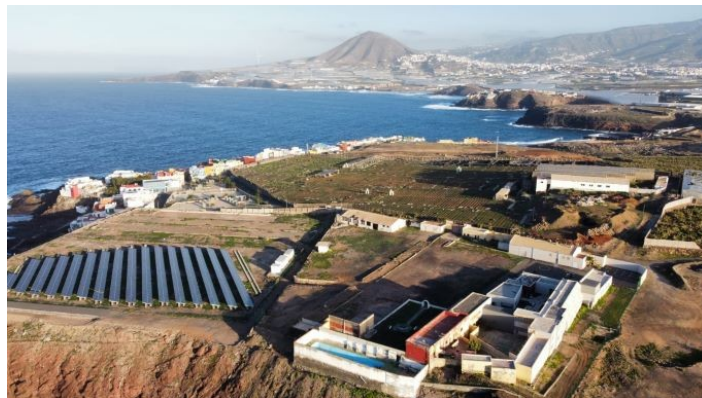
Imagen área del Parque, ubicado en La Punta de Gáldar

Durante el año 2021 continuó la ejecución de los sondeos de agua de mar para el uso de una desaladora que se instalará a lo largo del año que viene en el parque, además de una depuradora para conseguir el ciclo integral del agua en este espacio.