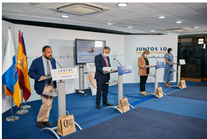
Imagen de la presentación de la Feria en el Gobierno de Canarias.

La empresa Lexis Comunicación se encargó de la publicidad y la comunicación del evento. Se redactaron 8 notas de prensa y una convocatoria de celebración de la feria. Se realizaron diferentes adaptaciones de la imagen para su publicación en redes sociales como Facebook, Instagram y Twitter, así como para la web de la Mancomunidad del Norte. Igualmente, se grabó un spot publicitario para la TV Canaria y un video final del evento.