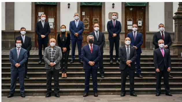
Imagen: Acto de cambio de Presidencia de la Mancomunidad, celebrado el 15 de enero

Durante el año 2021, el municipio de Artenara ha ostentado la presidencia de la Mancomunidad, y las vicepresidencias, los municipios de Arucas y Teror.