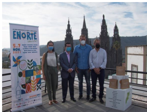
Imagen de la prestación de la imagen de la Feria

El día 20 de octubre se celebró, en la terraza de la Mancomunidad del Norte, la primera rueda de prensa en la que se presentó la imagen y puesta en marcha de ENORTE 2021, no sólo como un acontecimiento socioeconómico de gran importancia para el Norte, sino también para el resto de la Isla.