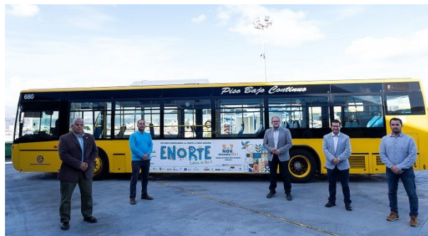
Imágenes de la presentación de la guagua el 26 de octubre en las cocheras de Guaguas Municipales

También se contó, con la colaboración de Guaguas Municipales, que contribuyó con dos guaguas para dar publicidad de la Feria en Las Palmas de Gran Canaria durante un mes.