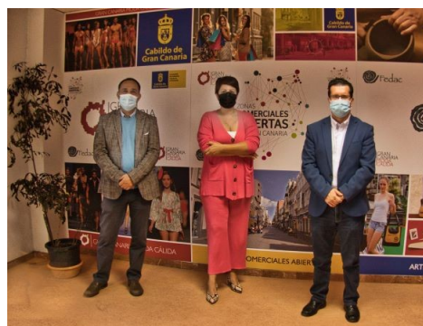
Imagen de la reunión con la Consejera de Industria , Comercio y Artesanía del Cabildo

El 28 de octubre se presentó a la Consejería de Industria, Comercio, y Artesanía del Cabildo de Gran Canaria la imagen de la feria y las actividades programadas, con la asistencia del Presidente de la Mancomunidad y el Alcalde de Arucas.