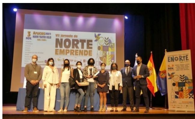
Imagen del ganador del premio a mejor idea de negocio 2021

Se organizó la VII Jornada Norte Emprende, realizada el 3 de noviembre, con la colaboración de la Sociedad de Promoción Económica de Gran Canaria (SPEGC), que se celebraron en el Nuevo Teatro Viejo de Arucas, dirigida a emprendedores, empresarios y público en general. En la que participaron 17 ideas de negocio. En esta edición la “Mejor idea de Negocio para el Norte de Gran Canaria” del año 2021 recayó en Jatila Cosmética.