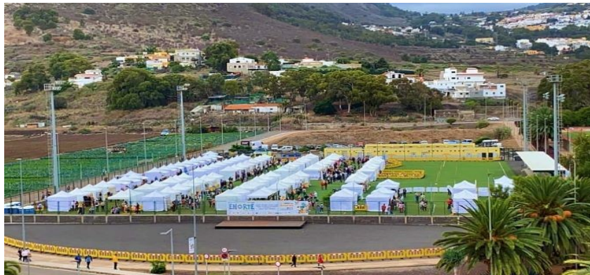
Imagen del campo de fútbol Elias Rizkallal (Arucas)

La Feria Empresarial del Norte ha sido un ejemplo palpable de la potencialidad económica de la Comarca Norte, así como una excelente herramienta que contribuye a revitalizar y dinamizar el sector empresarial y crear nuevas expectativas comerciales tras la pandemia. Además, de demostrar que la organización de este tipo de eventos es posible en condiciones de seguridad para los expositores y visitantes.