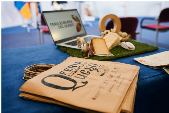
Imagen de las bolsas realizadas para la entrega de los quesos