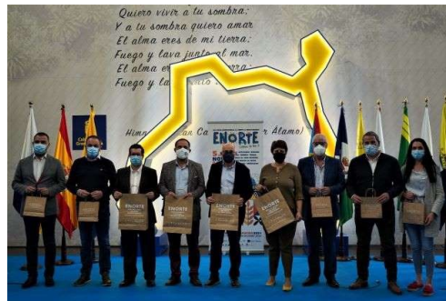
Imagen de la Rueda de prensa celebrada en el Cabildo de Gran Canaria el 4 de noviembre