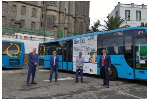
Imagen de la presentación el 25 de octubre, en el aparcamiento junto a la iglesia de San Juan.

en dos de las guaguas que recorren el trayecto entre Las Palmas de Gran Canaria y Agaete.