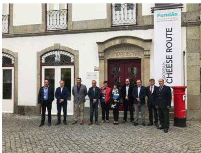
Imagen: Miembros de la Asamblea de AREQ

En el mes de octubre se celebró en Fundão (Portugal) la asamblea de la asociación, que acordó celebrar en el mes de marzo de 2018 la siguiente Asamblea ordinaria.