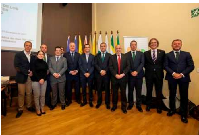
Imagen: Acto de cambio de Presidencia de la Mancomunidad, celebrado el 11 de enero de 2017.

Durante el año 2017, el municipio de Santa María de Guía ha ostentado la presidencia de la Mancomunidad, y las vicepresidencias los municipios de Firgas y Moya.