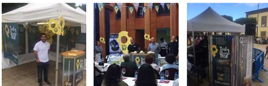
Imagen: Actos de celebración de la Fiesta del Queso en Santa María de Guía.

Durante este año el proyecto europeo contribuyó a la celebración de la “ Fiesta del Queso ” de Santa María de Guía , que cumplió su 40 Aniversario, realizando diversas actividades, como catas, conferencias, actuaciones, etc. que contribuyeron en el éxito de la celebración.