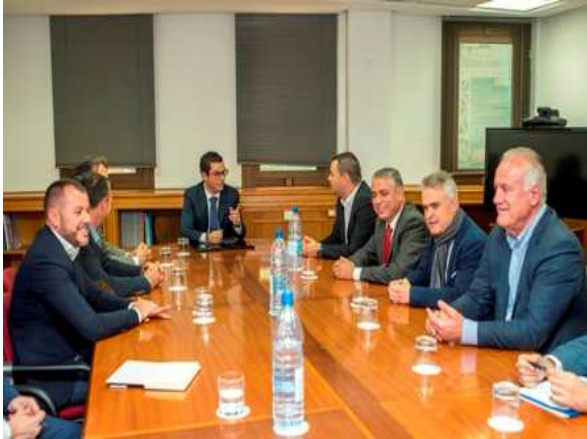
Imagen: Reunión con el Vicepresidente y Consejero de Obras Públicas del Gobierno de Canarias. Febrero 2017