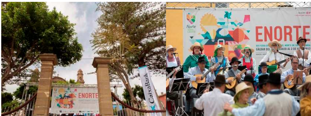
Imagen de la pancarta realizada con la imagen de la Feria que se utilizó en el escenario principal de las actuaciones musicales