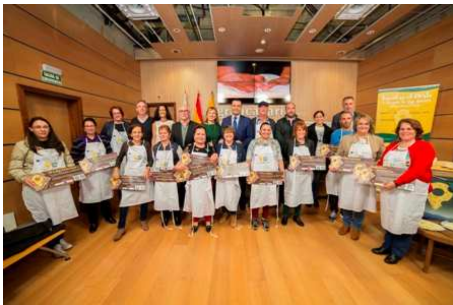
Imagen: Rueda de presentación de las rutas. Enero 2018