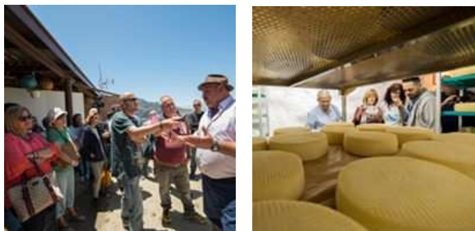
Imagen: Actos de celebración de GastroNorte en Artenara.

Finalmente, se realizó una ruta piloto del queso del Norte de Gran Canaria para periodistas, agencias de viaje y asociaciones para testear las rutas del queso del Norte de Gran Canaria que se realizaron definitivamente.