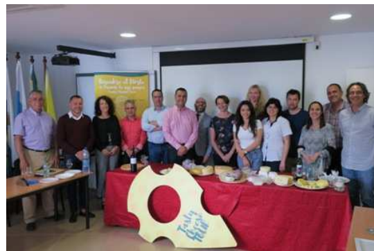
Imagen: Visita de los Socios Europeos al Norte

Los socios de este proyecto se desplazaron hasta Gran Canaria para realizar la última reunión de trabajo del proyecto y para conocer, de primera mano, una de las rutas del queso planteadas por la Mancomunidad del Norte en el mes de mayo.