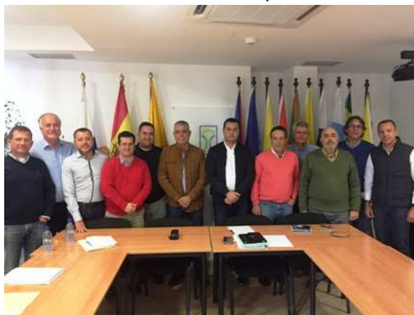
Imagen: Reunión Foro Roque Aldeano. Febrero 2017

Desde la Mancomunidad también se ha estado presente en las reivindicaciones y la búsqueda de financiación necesarias para la finalización de la carretera de La Aldea – El Risco de Agaete , cuya apertura se realizó en el año 2017. En este sentido señalar que se está trabajando de forma conjunta para que el tramo pendiente desde el Risco de Agaete-Agaete tenga ficha financiera lo antes posible para garantizar su ejecución urgente y prioritaria, tras la revisión del proyecto técnico.