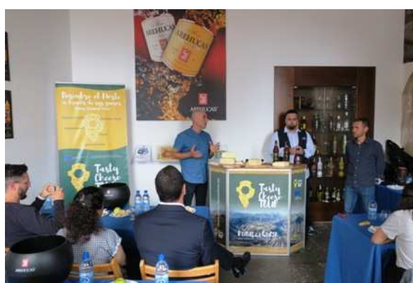
Imagen: Cata de Ron y Queso del Norte el 22 de mayo

Durante este año el proyecto europeo contribuyó a la celebración de la “ Fiesta del Queso ” de Santa María de Guía , que cumplió su 40 Aniversario, realizando diversas actividades, como catas, conferencias, actuaciones, etc. que contribuyeron en el éxito de la celebración.