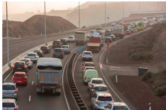
Imagen: Atascos GC-2. Octubre 2017

Durante este año se ha vuelto a realizar un importante esfuerzo de coordinación técnica y política con el objetivo de la búsqueda de una solución al tramo de la GC-2, a su paso por los municipios de Arucas y Moya, pendientes de determinar el trazado. En este sentido señalar que se ha hecho un especial seguimiento de los atascos de la GC-2, durante el último trimestre del año, en su acceso a Las Palmas de Gran Canaria.