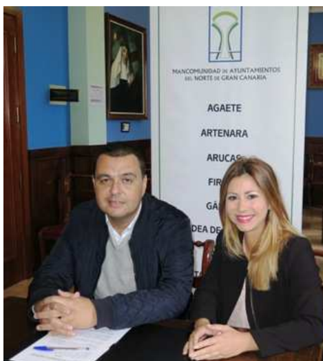
Imagen: Acto de presentación del proyecto, celebrado el 11 de enero.

El proyecto fue aprobado por el Cabildo y está desarrollándose hasta marzo de 2018.