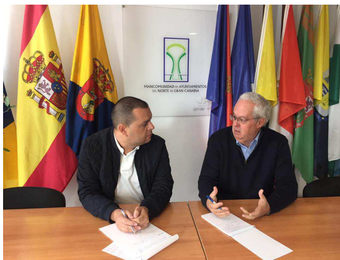
Imagen: Reunión de trabajo del 20 de enero de 2017

La Mancomunidad de Ayuntamientos del Norte de Gran Canaria colabora con la Federación de Empresarios Comarcal (FENORTE) en la estrategia de defensa de los intereses comarcales. Organizando actos, reuniones, etc. a lo largo del año en función de un convenio firmado entre ambas partes en el año 2012.