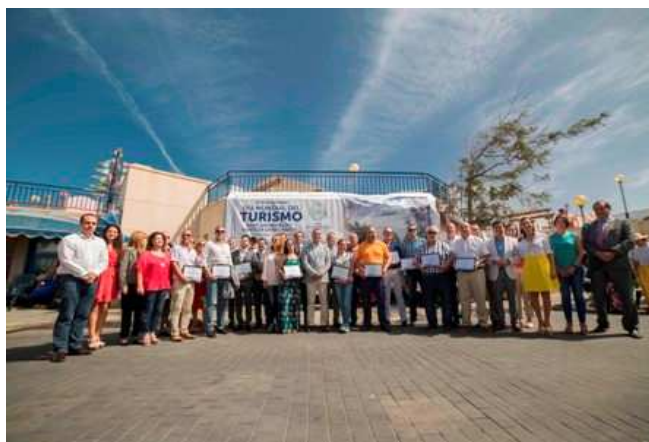
Imagen: Celebración Día Mundial del Turismo

Con la llegada del primer barco al muelle de Las Nieves empezó la celebración del Día Mundial del Turismo en el Norte de Gran Canaria, cuyos pasajeros fueron recibidos a su llegada a la Isla con café de Agaete y suspiros de Moya, acompañados de la música de la Banda Gran Canaria.