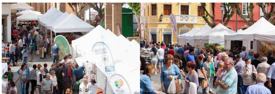
Imágenes de Enorte 2017

La Mancomunidad de Ayuntamientos del Norte Gran Canaria, junto al resto de administraciones y organizaciones participantes, son conscientes de que la mejora de la calidad del tejido empresarial ha de plantearse a través de un continuo esfuerzo de diversificación, innovación y mejora de la calidad en la prestación de servicios para lograr la necesaria promoción empresarial.