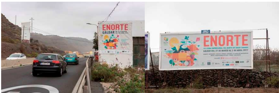
Imagen de una las vallas publicitarias instaladas en la GC-2