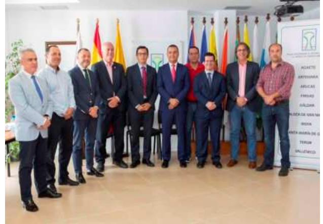
Imagen: Visita del Vicepresidente y Consejero de Obras Públicas del Gobierno de Canarias a la Mancomunidad. Junio 2017

Durante este año se ha vuelto a realizar un importante esfuerzo de coordinación técnica y política con el objetivo de la búsqueda de una solución al tramo de la GC-2, a su paso por los municipios de Arucas y Moya, pendientes de determinar el trazado. En este sentido señalar que se ha hecho un especial seguimiento de los atascos de la GC-2, durante el último trimestre del año, en su acceso a Las Palmas de Gran Canaria.