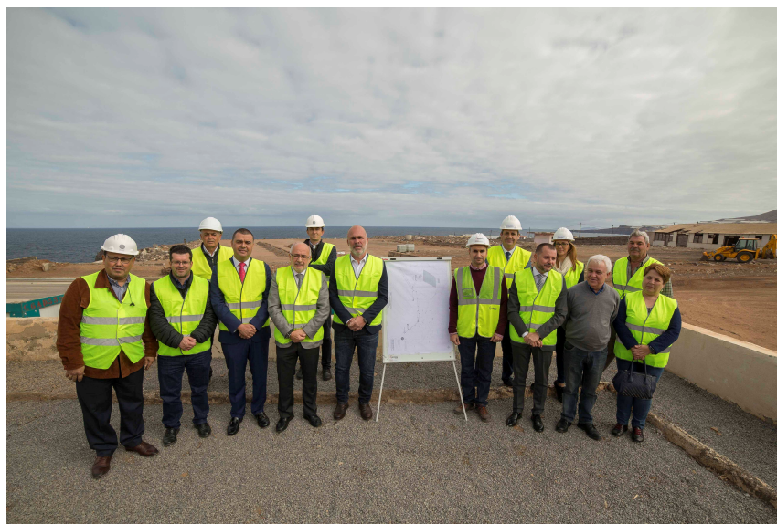
Imagen: Visita Presidente del Cabildo a las obras. Diciembre 2017.

La planta solar contará con una potencia nominal de 475kW generada por 1.770 módulos fotovoltaicos. Serán instalados 450kW en estructura fija y 25kW en seguidor de un eje, al mismo tiempo que será desarrollada toda la instalación de baja y media tensión con un centro de transformación de 630 kVA.