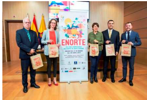
Imagen de la Rueda de prensa celebrada en el Cabildo de Gran Canaria el 30 de marzo