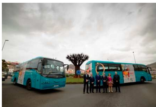
Imágenes de la presentación de las dos guaguas el 14 de marzo.

Se suscribió de nuevo el compromiso de colaboración con la empresa GLOBAL , de forma que se colocaron varios vinilos publicitarios en dos de las guaguas que recorren el trayecto entre Las Palmas de Gran Canaria y Agaete.