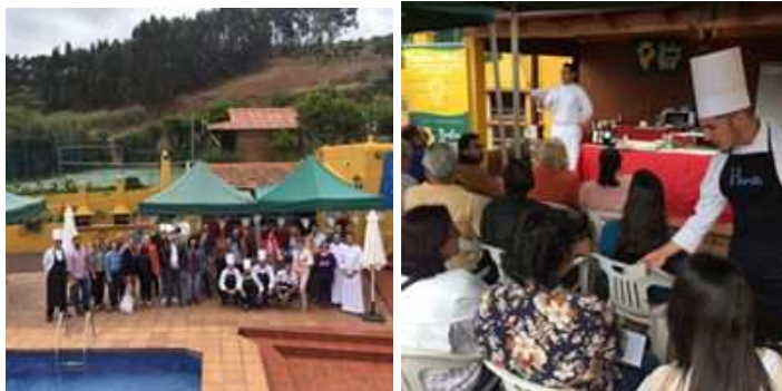
Imagen: Schowcooking celebrado en Moya.

Se realizó en el municipio de Artenara el concurso GastroNorte, en colaboración con la Asociación de Empresarios de Artenara, en el que dos grupos de estudiantes concursaron con platos elaborados a base de quesos de la Comarca.