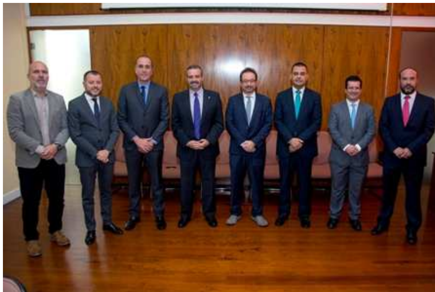
Imagen: Acto de firma del convenio. Enero 2018

El 23 de enero de 2018, se realizó la firma del Convenio en la sede del rectorado de la Universidad de Las Palmas de Gran Canaria: