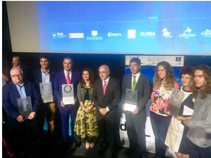
Imagen: Acto de entrega del premio en el Museo Elder en Las Palmas de Gran Canaria