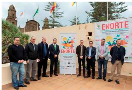
Imágenes de la Rueda de Prensa celebrada el 3 de marzo.

Se suscribió de nuevo el compromiso de colaboración con la empresa GLOBAL , de forma que se colocaron varios vinilos publicitarios en dos de las guaguas que recorren el trayecto entre Las Palmas de Gran Canaria y Agaete.