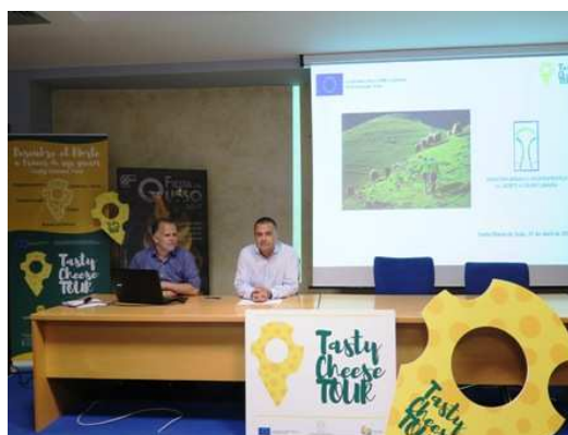
Imagen: Presentación del proyecto 28 abril en Sta. Mª de Guía

El proyecto "TastyCheeseTour", liderado por la Mancomunidad, tuvo como objetivo el desarrollo del turismo gastronómico basado en el queso en toda Europa. Comenzó el 1 de abril de 2016 y finalizó en junio de 2017. El presupuesto total del mismo ascendió a 238.333,00 euros, de los que la Unión Europea cofinancia el 75% a través del programa COSME.