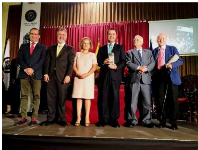
Imagen: Acto de entrega de los premios Gourié.

Este premio constituye un importantísimo reconocimiento a los concejales que han trabajado por el Norte de Gran Canaria desde las primeras elecciones municipales de la democracia en el año 1979 hasta la actualidad. Su visión de “unir para construir” ha sido todo un éxito, que ha demostrado que la Mancomunidad de Ayuntamientos del Norte de Gran Canaria fue, desde su origen, un ejemplo de trabajo conjunto por una Comarca que necesitaba de todo el apoyo y colaboración de las administraciones y la ciudadanía, tal y como señaló el Presidente de la Mancomunidad en el acto de entrega del galardón celebrado en la Sede de la Heredad de Arucas y Firgas, que fue entregado por el Vicepresidente del Cabildo, D. Ángel Víctor Torres.