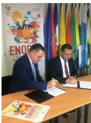
Imágenes de la firma del Convenio con la RTVC el 17 de marzo.

La Mancomunidad del Norte firmó, un año más, un acuerdo con la Televisión Autónoma para emitir un spot promocional, con una duración de veinte (20) segundos, cuya emisión comenzó quince días antes del inicio de la Feria y concluyó el día 2 de abril. Igualmente, también se emitió en la Radio Autónoma la cuña publicitaria.