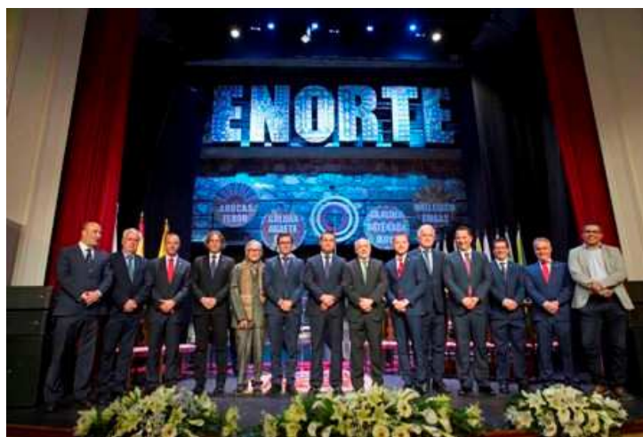
Imagen de la Inauguración Oficial de ENORTE 2017