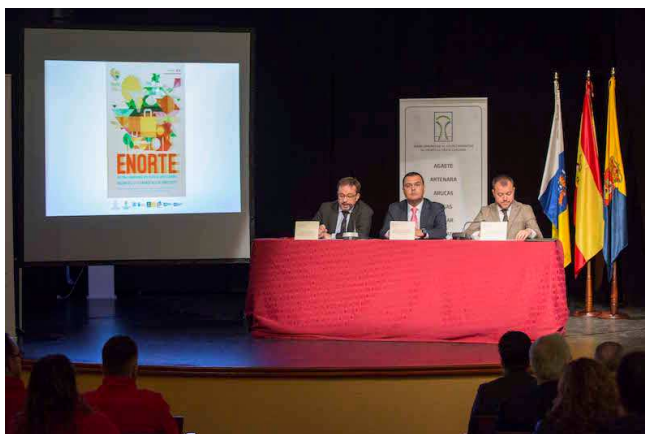
Imagen: Acto de inauguración de las Jornadas