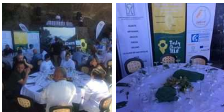
Imagen: Actos de celebración de GastroNorte en Artenara.

Se realizó en el municipio de Artenara el concurso GastroNorte, en colaboración con la Asociación de Empresarios de Artenara, en el que dos grupos de estudiantes concursaron con platos elaborados a base de quesos de la Comarca.