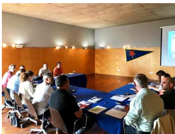
Imagen: Comité de Dirección 26 de octubre en Funchal