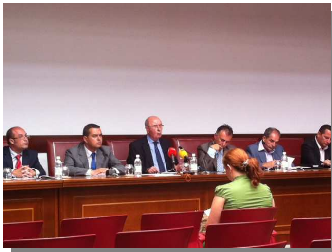
Foto: Acto celebrado en el Colegio de Abogados de Las Palmas (27/6/12)

El Tribunal Superior de Justicia de Canarias emitió un informe sobre el Proyecto de Bases para una nueva Demarcación Judicial en el territorio de la Comunidad Autónoma de Canarias, aprobado por la Sala del TSJ de Canarias el pasado 17 de septiembre de 2012.