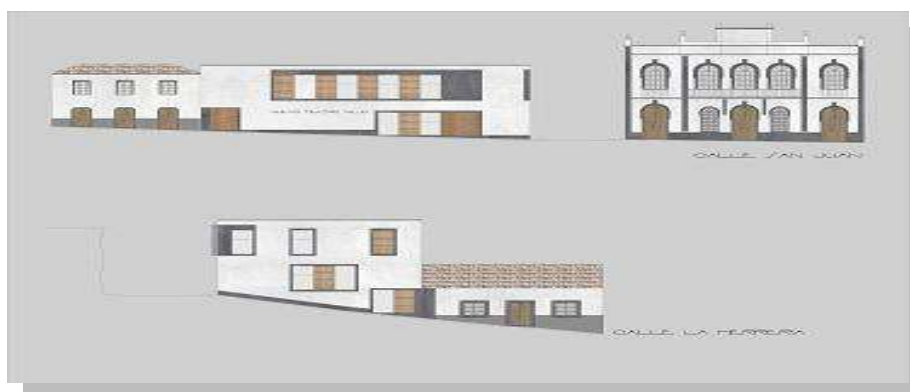
Diseño exterior del Complejo Multifuncional Comarcal de Arucas

Por otro lado, este año han comenzado las principales obras establecidas en las Medidas para la promoción y dinamización económica del Norte de Gran Canaria, financiado por el Gobierno de Canarias, conocido como el Plan de Competitividad. En el mes de noviembre se puso la primera piedra de la obra del Mercado Comarcal de Santa María de Guía, en ese mismo mes se sacó a licitación la obra del Complejo Multifuncional situado en Arucas en el que se situará la futura sede de la Mancomunidad y una sala multifuncional que prevé su finalización a lo largo del año 2011; asimismo se aprobó el acuerdo con la Universidad de Las Palmas de Gran Canaria para la construcción del Parque Tecnológico Comarcal situado en Gáldar