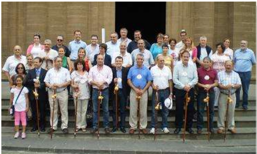
Peregrinación año Jacobeo a Santiago de Gáldar, en julio de 2010

Durante el año 2010 se han celebrado once Juntas Plenarias, además de Comisiones Informativas y reuniones técnicas. Se han llevado a cabo numerosos encuentros con las diferentes administraciones públicas y agentes sociales para solucionar asuntos relacionados con la Comarca.