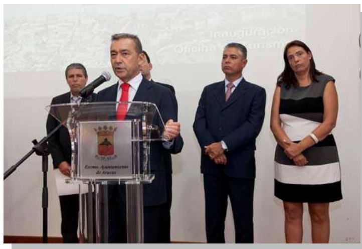
Acto inauguración Oficina de Turismo de Arucas

El Plan ha sido gestionado en su integridad por la Mancomunidad de Ayuntamientos del Norte de Gran Canaria. Cumpliendo los objetivos marcados por todas las administraciones, con el consenso de todos los agentes públicos y privados, a través de la Comisión de Seguimiento del Plan.