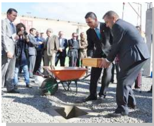
Primera piedra del Mercado Comarcal de Sta. Mª de Guía

Este año se ha puesto la primera piedra del Mercado Comarcal de Santa María de Guía, por parte del Presidente del Gobierno de Canarias. Se ha sacado a concurso el Complejo Multifuncional Comarcal, cuya ubicación está en el municipio de Arucas y se ha firmado el Convenio con la Universidad de Las Palmas de Gran Canaria para la creación de un parque tecnológico Comarcal en Gáldar.