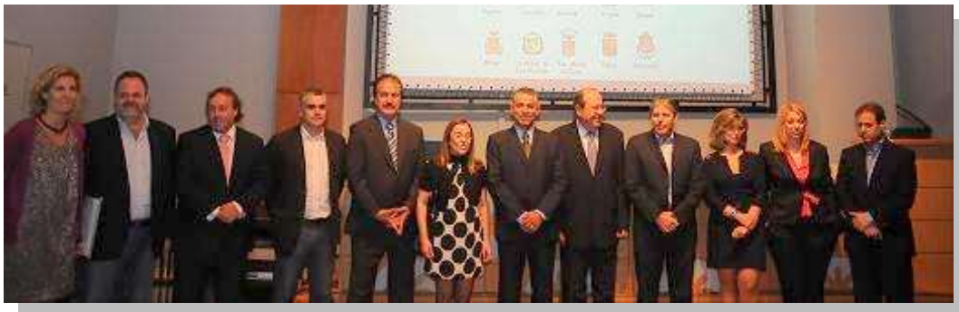
Acto firma convenio con la Obra Social de La Caja de Canarias

Desde la colaboración y la coordinación entre las administraciones, a todos los niveles, junto a los agentes sociales la Mancomunidad ha emprendido importantes proyectos de desarrollo socioeconómicos de la Comarca que justifican su sentido y necesidad presente y futura.