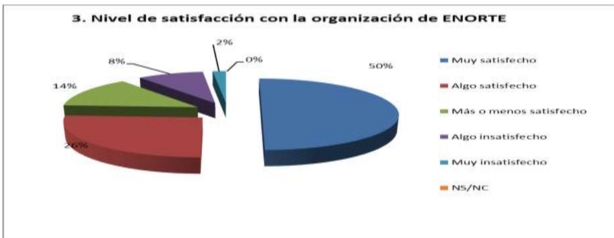
Tabla obtenida de los resultados de la encuesta trasladada a los empresarios participantes en ENORTE. Realización propia.

En las encuestas que se han realizado a los empresarios participantes en ENORTE , cabe destacar que el 76% de los empresarios participantes, quedaron muy satisfechos o satisfechos con la labor desarrollada a lo largo de los tres días de Feria por parte de la organización del evento y que se logró crear un espacio adecuado donde pudieron interactuar y mostrar sus negocios o sus ideas de negocio.